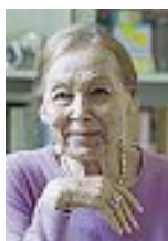
Edith Bruck

pensata per «offrire a studenti e docenti spazi di studio e relazione vicini alle principali attrazioni del centro città». A Palazzo Firenze resta la Biblioteca della Scuola di Roma, intitolata a Tullio De Mauro, accanto alla Biblioteca centrale. Fondata nel 1889, la Società Dante Alighieri promuove la lingua e la cultura italiane nel mondo. La scuola romana fa parte di una rete con sedi a Milano, Bologna, Firenze, Torino.